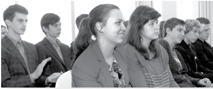
Anykščių jaunimas turėjo klausimų sėkmės verslininkams.

Ketvirtadienį Menų inkubatoriuje vyko jaunimui skirtas renginys „Verslas veža“, kuriame savo verslo sėkmės istorijomis ir patirtimi pasidalino žinomi šalies ir Anykščių krašto verslininkai.