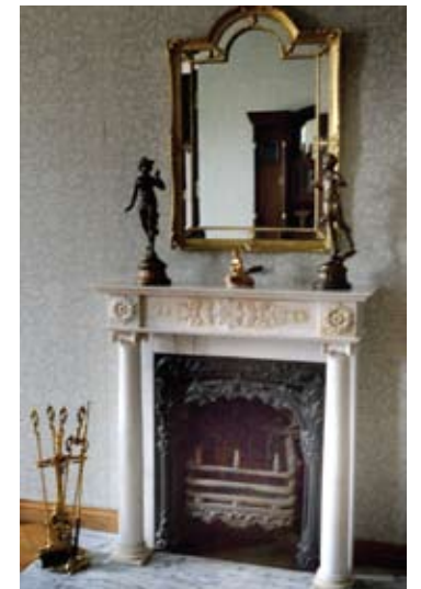
Dvaro kultūros vertybes, tokias kaip židiniai ir koklinės krosnys, pavyko išsaugoti todėl, kad dvare ilgai veikė mokykla.

1990 metais dvaras buvo sugrazintas Panevėžio vyskupijai, tačiau ši neturėjo pinigų jo restauracijai ir dvarą, kaip kalbama, už pusę milijono litų pardavė (beje, už Rusijos bankininkų reketą kalintam) vilnie-