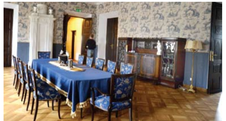
Viena iš dvaro salių.