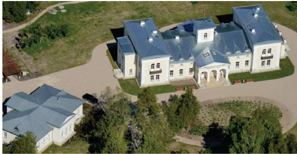
Burbiškio dvaras yra vos keletas kilometrų nuo Rubikių ežero.

1853 metais Lietuvos ir Lenkijos didikų Venclovavičių pastatyti dvaro rūmai yra bene gražiausi Anykščių rajone, dvaras su parku yra Burbiškio kraštovaizdžio architektūros draustinio dalis, dvaras įtrauktas į Europos paveldo lankytinų objektų sąrašą.