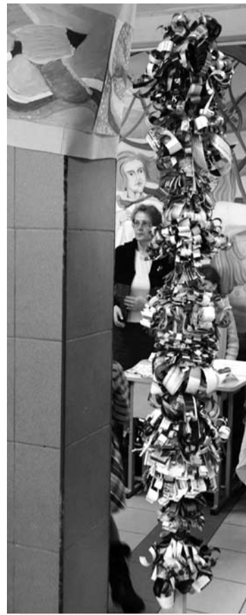
Trečiokai 2 metrų aukščio verba darė ir iš „Aukštaitiško formato“ žurnalo.