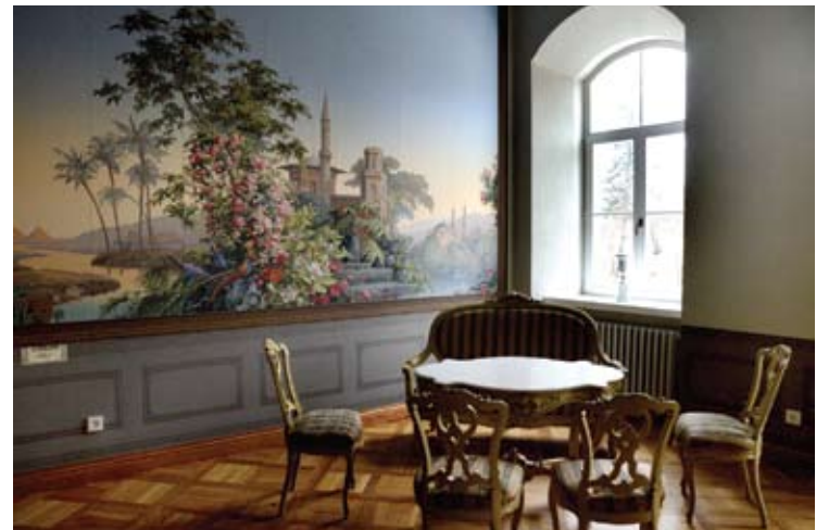
Šiuos tapetus, kaip teigia dvaro šeimininkai, pagal išlikusias nuotraukas pagamino ta pati Prancūzijos gamykla „Eldorado“.